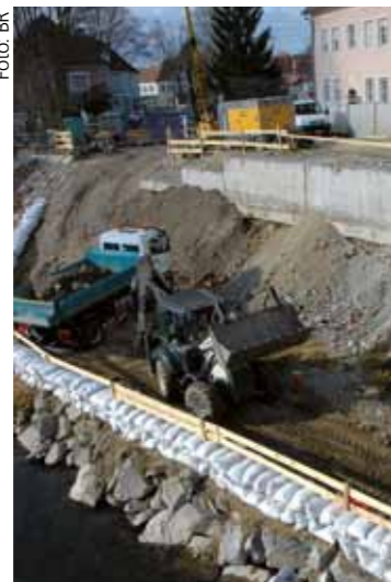
Bis Ende April werden die Bauarbeiten fertiggestellt.