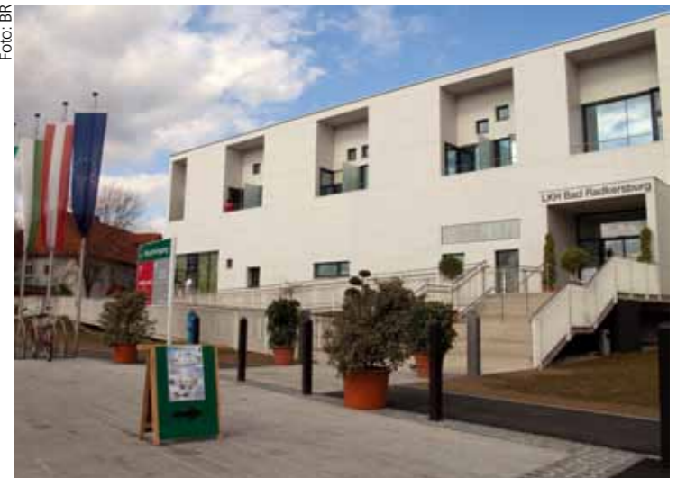
Das LKH Bad Radkersburg ist mit hohem Investitionsaufwand umgebaut bzw. erweitert worden.