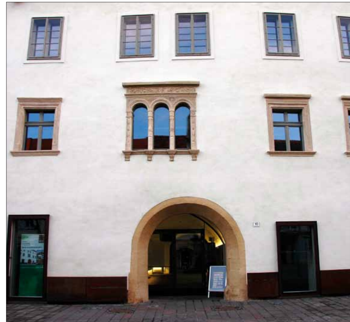
Hier schafft eine bislang unbekannte Urkunde plötzlich jede Menge an Erklärungsbedarf.