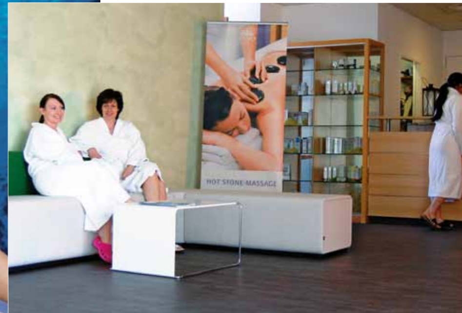
Das neue Vitalstudio (Bild oben), das in den Farben Orange und Hellgrün gehalten ist, wurde bereits fertiggestellt und gibt einen ersten Vorgeschmack auf die ab Ende des Jahres rundum revitalisierte Parktherme neu.