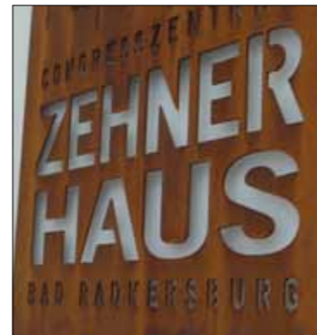
Zehnerhaus: deutliche Steigerung gegenüber 2010