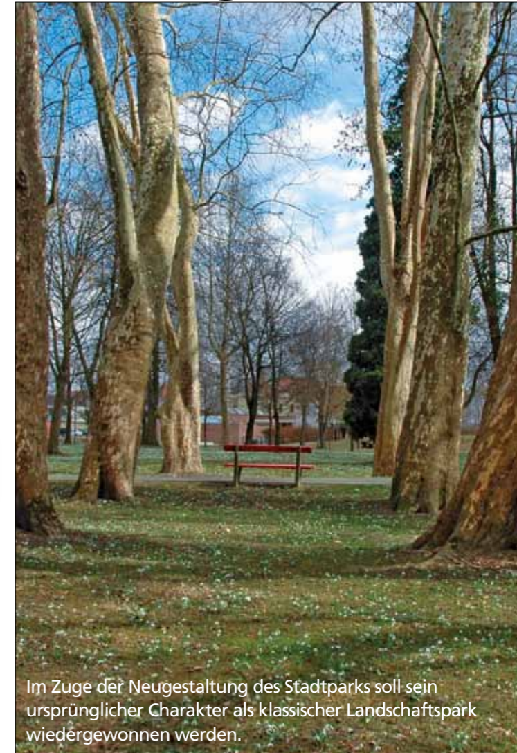
Im Zuge der Neugestaltung des Stadtparks soll sein ursprünglicher Charakter als klassischer Landschaftspark wiedergewonnen werden.